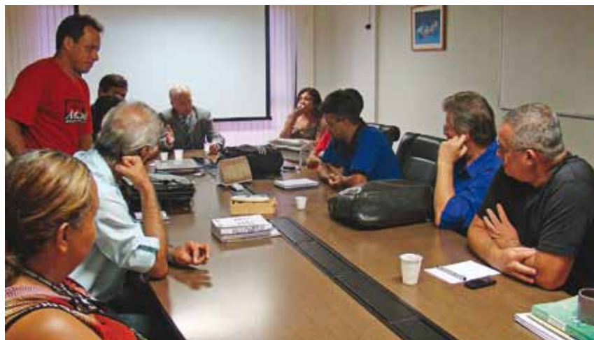
Conselheiros eleitos apóiam Sindicatos em negociação

Na avaliação atuarial, foi calculada a necessidade de reajuste de 200%, em média, para aqueles trabalhadores. Os conselheiros eleitos se colocaram em posição contrária ao reajuste por entender que esta