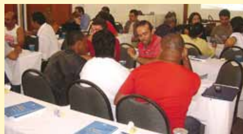
Curso realizado em Recife reuniu sindicalistas do nordeste

O curso é ministrado pela Global Conhecimento, e é dividido em dois dias, com carga horária