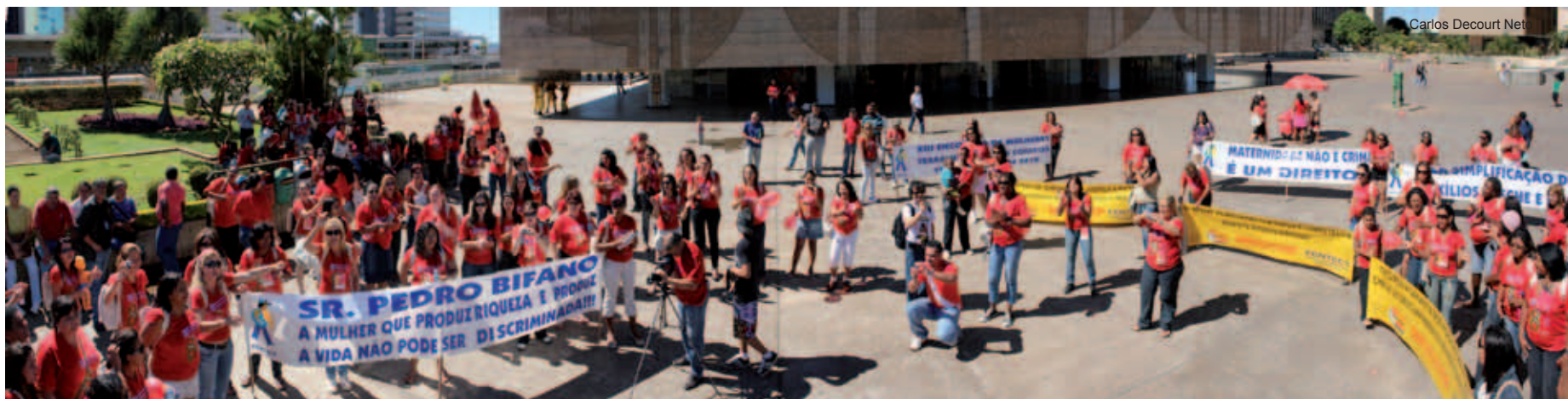
Ato Público das mulheres em frente ao prédio dos Correios em Brasília/DF

A Fentect realizou o 13º Encontro Nacional de Mulheres em Brasília/DF nos dias 19 e 20 de julho, com delegadas de todos os sindicatos. E aproveitando a grande presença feminina, a comissão organizadora do encontro realizou um ato público na porta do prédio central dos Correios na capital federal.