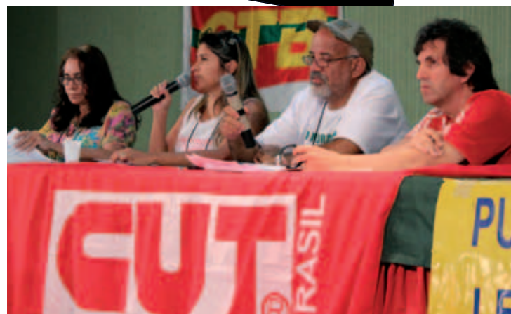
Membros do Conselho Fiscal e a Secretária de Finanças

A FENTECT espera que o novo diretor de Recursos Humanos apresente uma proposta digna.