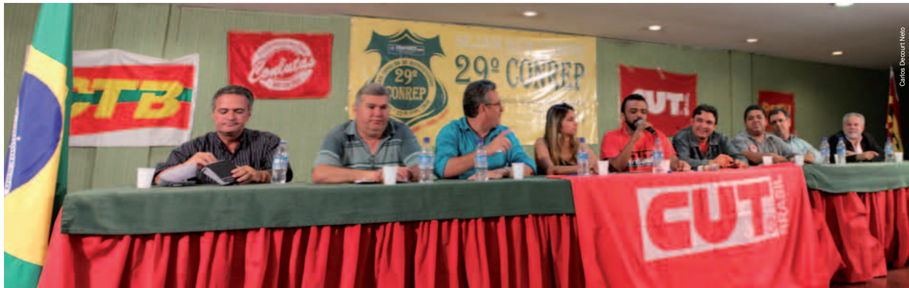
Mesa de abertura do 29º CONREP com a representação de várias entidades opniões diferentes, mostrando a pluralidade e a liberdade dentro da FENTECT

Maioria das entidades participaram do Conselho de Representantes e só aqueles que queriam tumultuar para impedir a elaboração de uma Jornada de Luta é que ficaram de fora, por conta própria ou por estarem em situação irregular